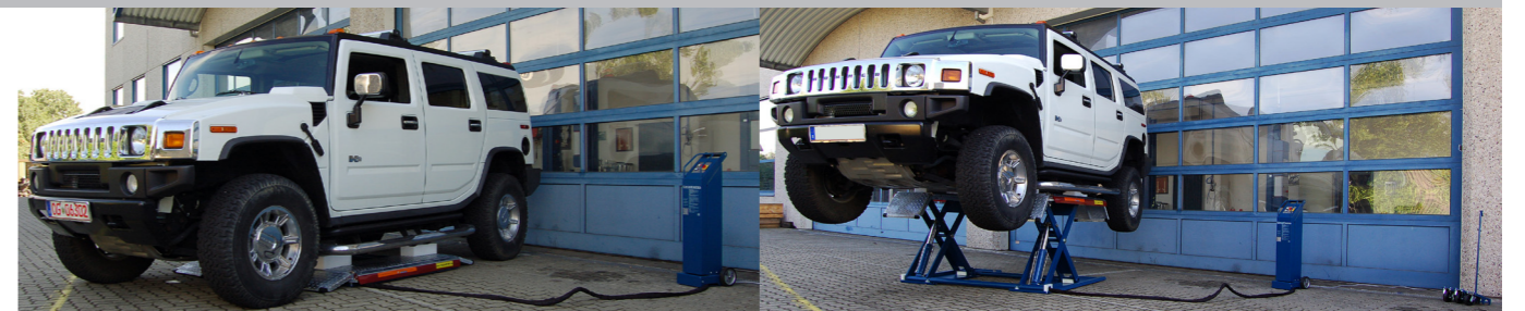
Capacidad de carga de hasta 3000 Kg (SPRINTER móvil 3000) y por tanto eleva vehículos todo terreno