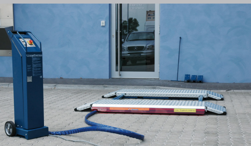
SPRINTER mobil 2500